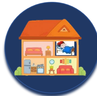
ابتعد عن الآخرين