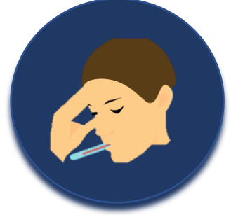
افحص الأعراض بالطبيب