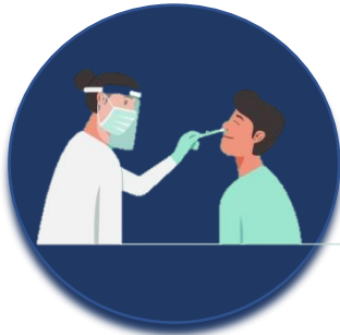
احصل على الاختبار